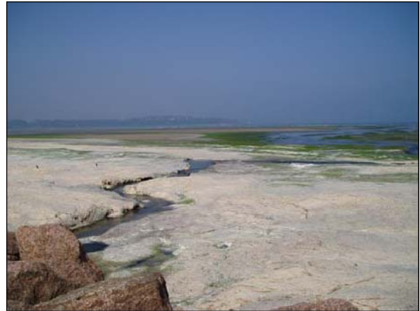
Figure 2 : Croûte blanche en surface d'un dépôt d'algues en putréfaction

Les micro-organismes sulfato-réducteurs, très abondants en eau de mer, vont utiliser les sulfates présents dans les algues et le milieu marin comme source d'oxygène, ce qui entraîne la formation de sulfure d'hydrogène ( H_2S ). Un mécanisme parallèle aboutit à la formation d'ammoniac ( NH_3 ) à partir des nitrates.