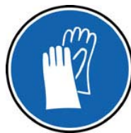
Port de gant