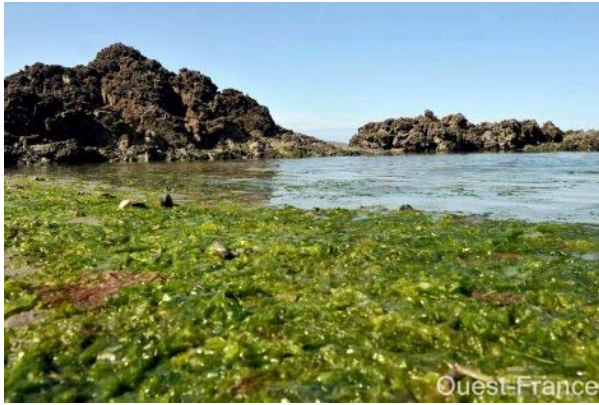
Figure 1 : Aspect des algues vertes fraîchement échouées, Côtes d'Armor