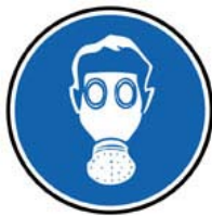
Port du masque