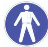
Port de vêtements de protection