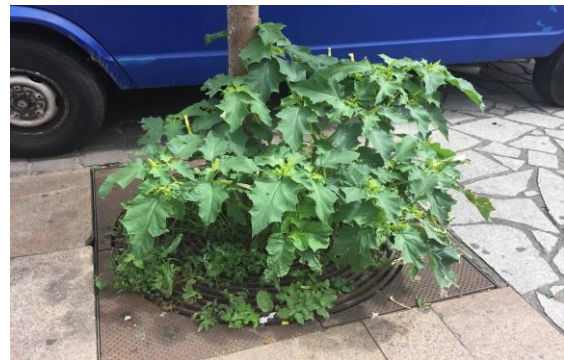
Figure 3 : Datura à l'état sauvage en zone urbaine

À la suite de ce signalement, une information a été transmise au Ministère de l'intérieur par la Direction générale de la santé, pour demander aux municipalités de procéder à l'arrachage des Datura surtout dans les lieux fréquentés par les jeunes publics. En Nouvelle Aquitaine, le CAP, la Cellule d'Intervention en Région (CIRE) de Santé Publique France, et le Centre d'Evaluation et d'Information sur la Pharmacodépendance et l'Addictovigilance (CEIP-A), en collaboration avec l'Agence Régionale de Santé (ARS) de Nouvelle Aquitaine ont transmis cette demande aux professionnels municipaux en charge de l'entretien des espaces verts pour une mise en application dans leur travail quotidien.