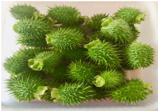
Figure 1 : Fruits du Datura

Les Datura représentent un genre de plantes bien connu pour leurs fleurs majestueuses en forme de trompettes, et sont souvent cultivées pour agrémenter les jardins. Certaines espèces comme Datura stramonium L. poussent également à l'état sauvage au gré du vent, là où on ne l'attend pas forcément. Le fruit est une capsule (cf. figure 1 ), mesurant de 5 à 10 cm de diamètre, recouverte d'épines effilées et qui contient un grand nombre de graines (plusieurs centaines).