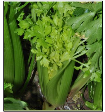
IVIA, fév. 2013 ©