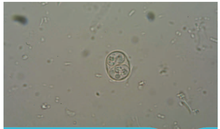
Oocyste de Toxoplasma gondii .