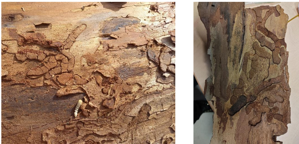
Figure 2 : à gauche : larve mature et galeries larvaires; à droite: logette nymphale (en marron foncé) (port de Sète, France, Octobre 2021, A. Roques).