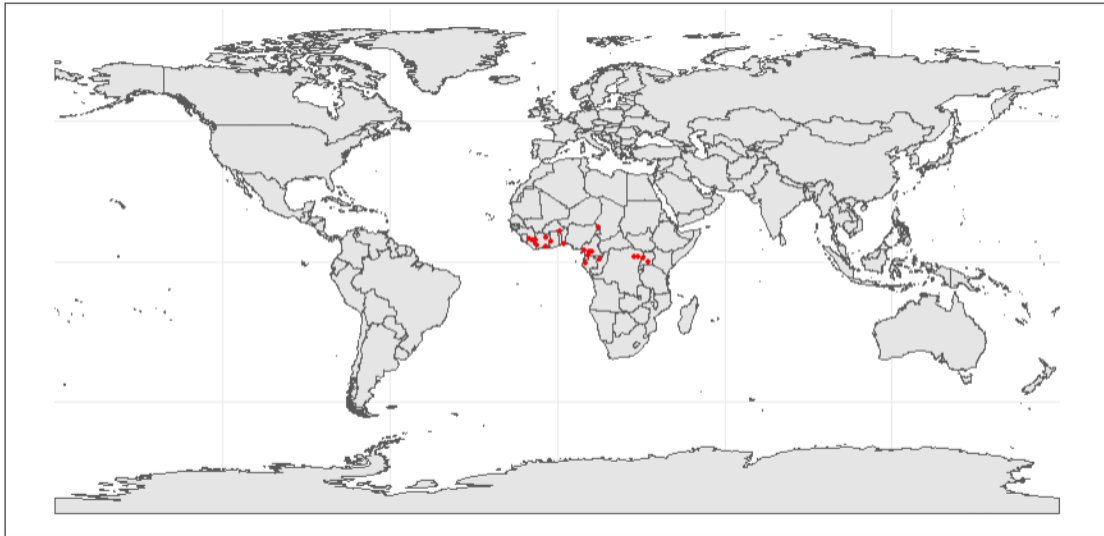
Figure 4 : Présence de Cordylomera spinicornis d'après la littérature scientifique (points rouges).

Les sources d'incertitude de ces estimations sont les suivantes :