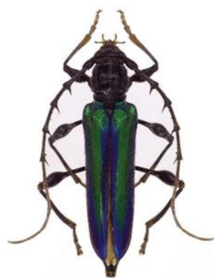
Raju et al. , 2019

Les larves de dernier stade mesurent environ 32 mm x 8 mm (Figure 2) et les nymphes 23 mm x 5 mm.