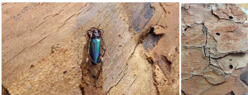
Figure 3 : Adulte prêt à émerger et trous de sortie imaginaires sur écorce (port de Sète Octobre 2021, A. Roques)

L'identification des spécimens se fait principalement sur la base de la morphologie des adultes. Le barcoding moléculaire peut également être utilisé, particulièrement pour les stades immatures. Plusieurs séquences d'un gène codant la cytochrome C oxydase 1 (COI) de C. spinicornis sont disponibles dans la plateforme « The Barcode of Life Data Systems (BOLD) », dont une d'un spécimen capturé à La Rochelle (Veillat et al. , 2024).