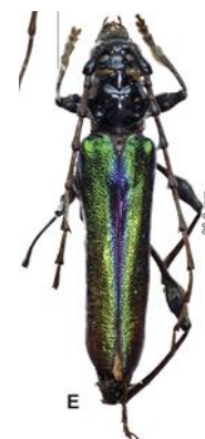
Ruzzier et al. , 2020