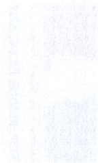
Table of Contents Page No.

The Corporation is committed to providing a return on investment to its shareholders.