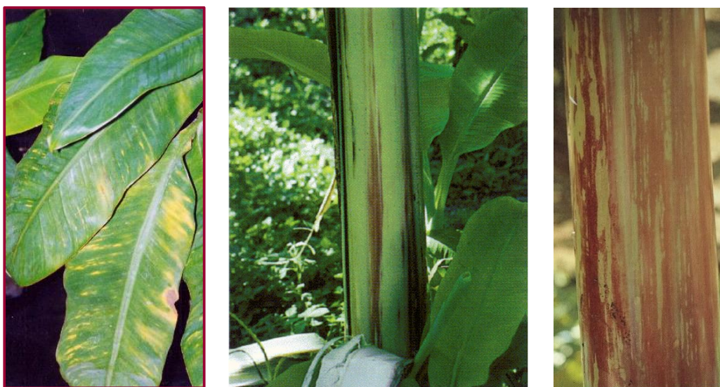
Figure 1 : Différents types de symptômes provoqués par le BBrMV (sur feuilles et pseudotracis)

Les symptômes typiques de mosaïque sont présents sur les bractées (petites feuilles qui recouvrent les rangées de fleurs sur la tige), mais ne sont pas visible avant l'émergence de la fleur. Le BBrMV est transmis par différentes espèces de pucerons comme Myzus persicae et Pentalonia nigronervosa selon le mode non persistant. Il est également transmis à travers la diffusion de matériel infecté comme les rejets de bananier.